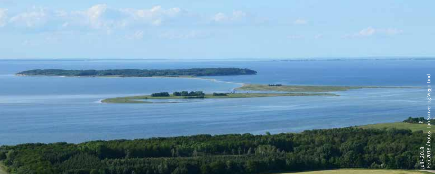
Juli - 2018 Feb. 2018