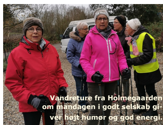
Vandreture fra Holmegaarden om mandagen i godt selskab giver højt humør og god energi.