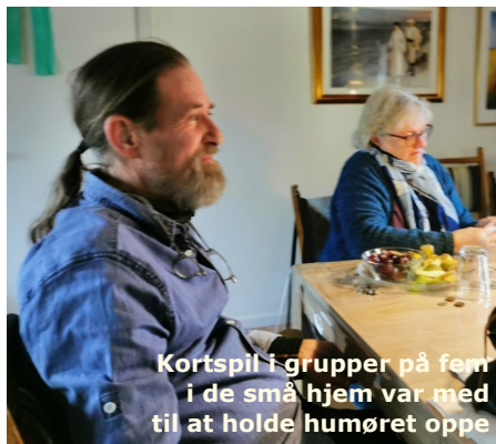
Kortspil i grupper på fem i de små hjem var med til at holde humøret oppe

En dejlig afslutning på denne noget anderledes sæson, vi ses igen efter sommerferien.