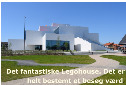
Det fantastiske Legohouse. Det er helt bestemt et besøg værd

Et fantastisk gensyn med Lego, og det nye "LEGO HOUSE". Vi havde 2 dygtige Play agenter, som viste os rundt i de 4 aktivitetsområder, som Lego House er bygget op af.