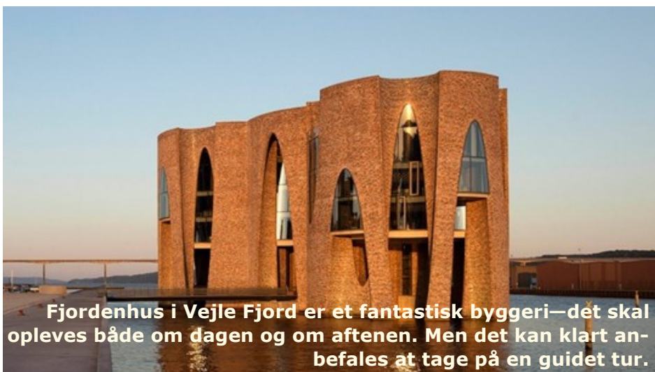
Fjordenhus i Vejle Fjord er et fantastisk byggeri—det skal opleves både om dagen og om aftenen. Men det kan klart anbefales at tage på en guidet tur.