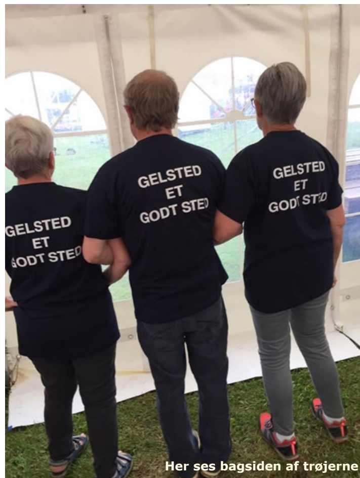
Her ses bagsiden af trøjerne