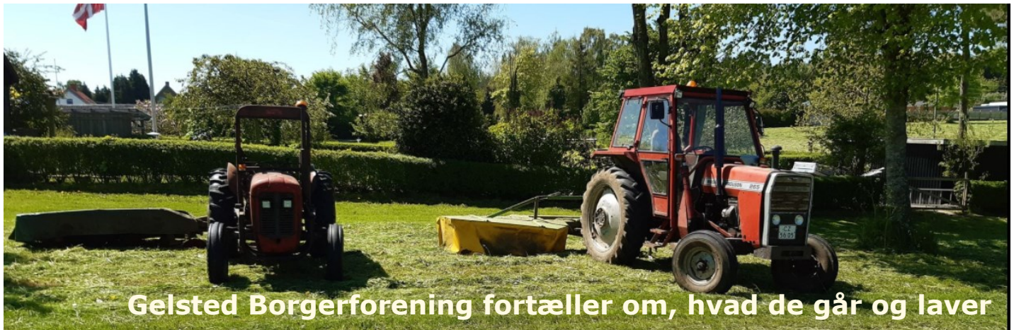
Gelsted Borgerforening fortæller om, hvad de går og laver