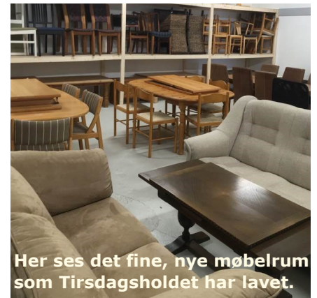
Her ses det fine, nye møbelrum som Tirsdagsholdet har lavet.