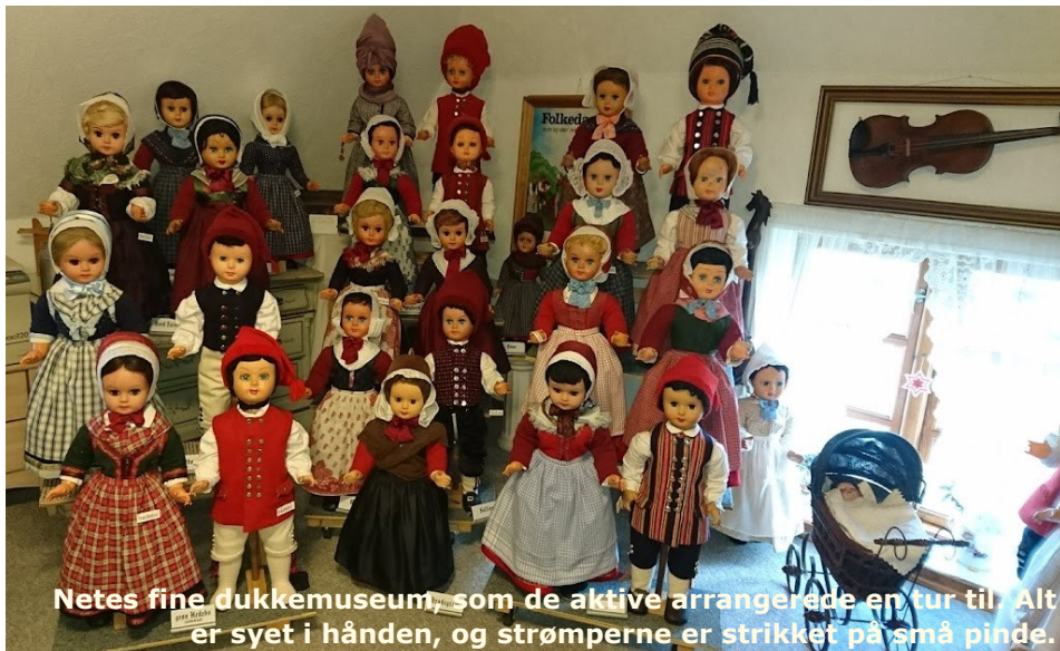
Netes fine dukkemuseum, som de aktive arrangerede en tur til. Alt er syet i hånden, og strømperne er strikket på små pinde.

Kirk Kapitals kontorer befinder sig på de to øverste etager. Tæppet er cirkelrundt og vævet i et stykke. Der blev bygget et hus til væven. Bordlamperne er med mundblæst glas. Kantine er også en cirkel, derfor er alt inventar ligeså – meget spændende. Vinduerne