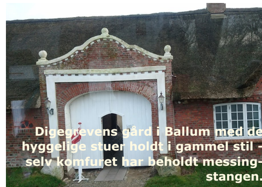
Digegrevens gård i Ballum med de hyggelige stuer holdt i gammel stil - selv kømuret har beholdt messingstangen.

Digegrevens gård i Ballum Vi fortsætter turen ad Mærskvej til Østerende Ballum. Her ligger den gamle digegrevens gård fra 1857 på toppen af bakken. Gården er restaureret i oprindelig stil med støtte fra Realdania og A.P. Møller Fonden.