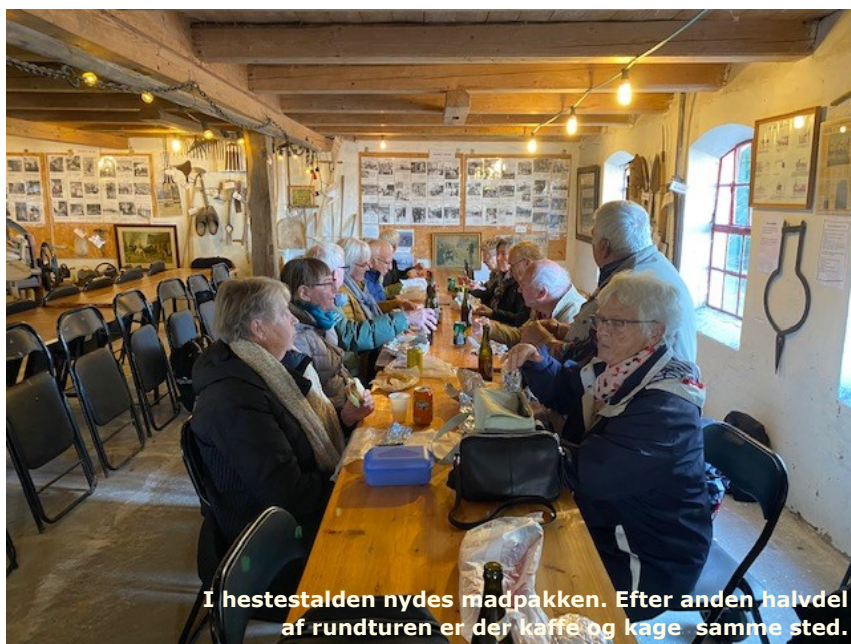
I hestestalden nydes madpakken. Efter anden halvdel af rundturen er der kaffe og kage samme sted.